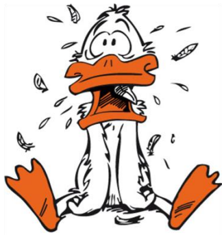
Jeunesse va Wäiswampich